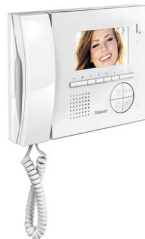
Håndsettmodul for V12E Gir mulighet for lavttalende samtale i situasjoner hvor det ikke er hensiktsmessig med høyttalende samtale.