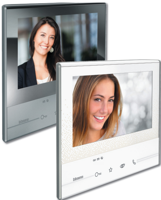
Class300 7" touchskjerm.

Knapp for åpning av dør. Knapp for tenning av trappelys. Knapp for tilbakekall til dør. Trinnløs regulerbar ringestyrke Valgbare ringesignaler (16 stk)