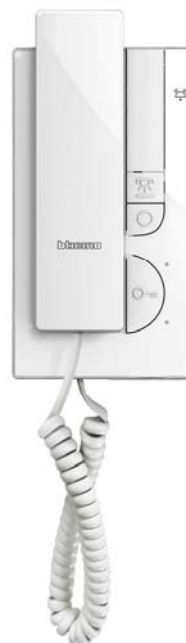
Class100 A12C 344262

2veis høyttalende samtale. Trinnløs regulering av ringestyrke. Trinnløs regulering av lyttevolum. Knapp for tilbakekall til dør Knapp for tenning av trappelys.