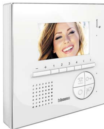
Class100 V12E 4,3" skjerm

Omfattende muligheter via OSD programmering.